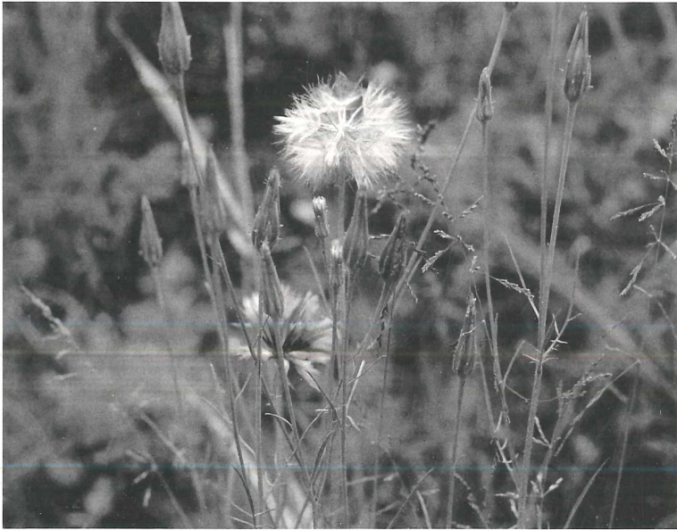
Abb. 1: Scorzonera laciniata L. an der Asse (nördliches Harzvorland).

Scorzonera laciniata ist eine zartwüchsige, wenig auffällige zitronengelb blühende Kompositenart. Aus einer dünnen Pfahlwurzel wird zumindest ein aufrechter Stengel getrieben. Die Laubblätter sind in der Regel fiederspaltig, wobei die Blätter von Jungpflanzen öfter pfriemlich und ungeteilt sind. Abbildungen dieser Art finden sich bei HEGI (1987), ROTHMALER (1987)