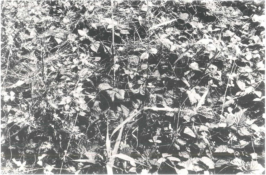
Abb. 2: Cuscuta lupuliformis - Rubetum caesii ass. nov. am Rheinufer bei Götterswickerhamm (Kr. Wesel).

Schiffahrt und damit auch zum Bau von Siedlungen und Städten bevorzugt. Um zu verhindern, daß durch weitere Abtragung von Ufermaterial am Prallhang Anlagen und Siedlungen gefährdet werden oder daß landwirtschaftlich genutzte Fläche durch unkontrollierte Verlagerung des Rheins verloren geht, wird diese Uferseite in der Regel durch Uferwälle oder ähnliche Schutzeinrichtungen aus Bruchsteinen festgelegt. Einer der bevorzugten Wuchsorte von Rubus caesius sind aber gerade diese steilen Uferbefestigungen, wo die Art dann bestandsbildend auftreten kann. (Abb. 2). Zusammen mit der Kratzbeere tritt dann als deren Parasit regelmäßig auch Cuscuta lupuliformis auf, wodurch die Bevorzugung des Prallhangs zu erklären ist. Man kann daher sagen, daß das Vorkommen von Cuscuta lupuliformis in gewissem Maße anthropogen begünstigt ist. In einem Fall wurde Rubus caesius mitsamt seinem Scharotzer sogar als Fugenbesiedler einer rheinnahen Ziegelsteinmauer gefunden. Darüber hinaus scheint jedoch auch an unbefestigten Uferabschnitten eine gewisse Steilheit des Ufers ein Vorkommen von Rubus caesius zu begünstigen. An den flachen Ufern des Gleithangs geht dagegen die ufernahe Schlammflächen- und Kiesbankvegetation landeinwärts oft unmittelbar in vom Menschen genutzte Grünlandgesellschaften über.