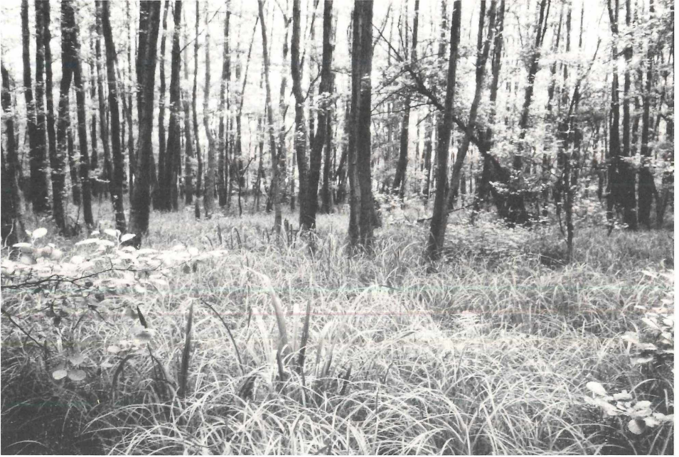
Abb. 2: Schwarzerlen-Bruchwälder ( Carici elongatae-Alnetum ) mit aspektbestimmender Sumpf-Segge ( Carex acutiformis ) in der Krautschicht sind in den Feuchtgebieten des Untersuchungsraumes weit verbreitet, insbesondere im Auenbereich der Schwalm. Im Bildvorder- und -mittelgrund sind die langen, schwertförmig emporragenden Blätter der Gelben Schwertlilie ( Iris pseudacorus ) zu erkennen, die an nährstoffreichen Standorten das C.-A. iridetosum gegenüber dem C.-A. typicum differenziert.