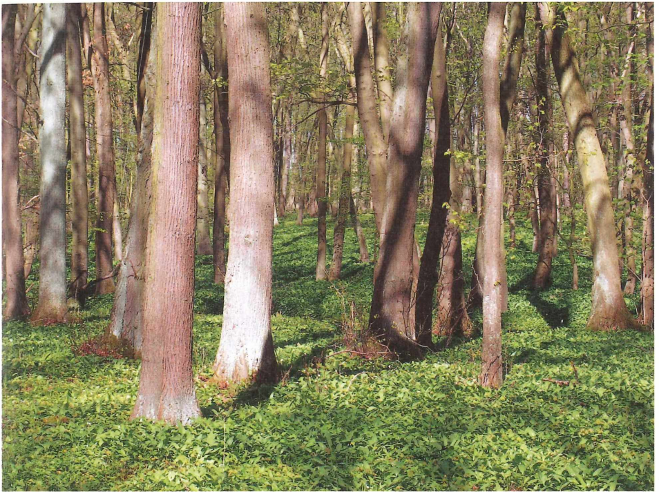
Abb. 1. Winterlinden-reicher Eichen-Hainbuchen-Wald ( Stellario-Carpinetum stachyetosum ) im Waldgebiet Lindig (!) im Nationalpark Hainich. Frühjahrsaspekt mit Allium ursinum , Leucojum vernum , Anemone ranunculoides , Ranunculus ficaria , Lilium martagon u. a. (Andreas Mölder, 28. April 2005).