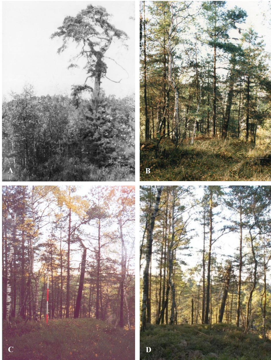
Abb. 1. Ansicht der Dauerbeobachtungsfläche 4 (Brand: 1953). A) 1963 (Foto: W. Schulz), B) 1992 (Foto: F. Wagner), C) 2002 (Foto: J. Kirschner), D) 2014 (Foto: B. Laupichler). Der Pinus sylvestris -Altbaum von 1963 ist vor 1992 abgestorben, während der Jungwuchs von Betula pendula und P. sylvestris inzwischen die obere Baumschicht erreicht hat und den Stumpf des Altbaums überschattet.

Fig. 1. Aspect of permanent observation plot 4 (fire: 1953). A) 1963 (Photo: D. Schulz), B) 1992 (Photo: F. Wagner), C) 2002 (Photo: J. Kirschner), D) 2014 (Photo: B. Laupichler). The overmature individual of Pinus sylvestris A perished before 1992, while the young individuals of Betula pendula and P. sylvestris have reached the upper canopy layer in the meantime, shading the remaining stump of the dead P. sylvestris .